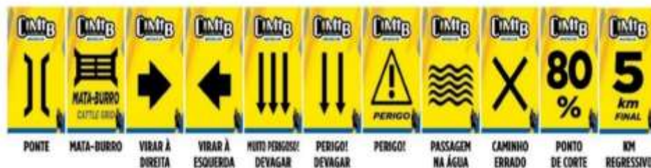
Figura 2 Exemplo CIMTB